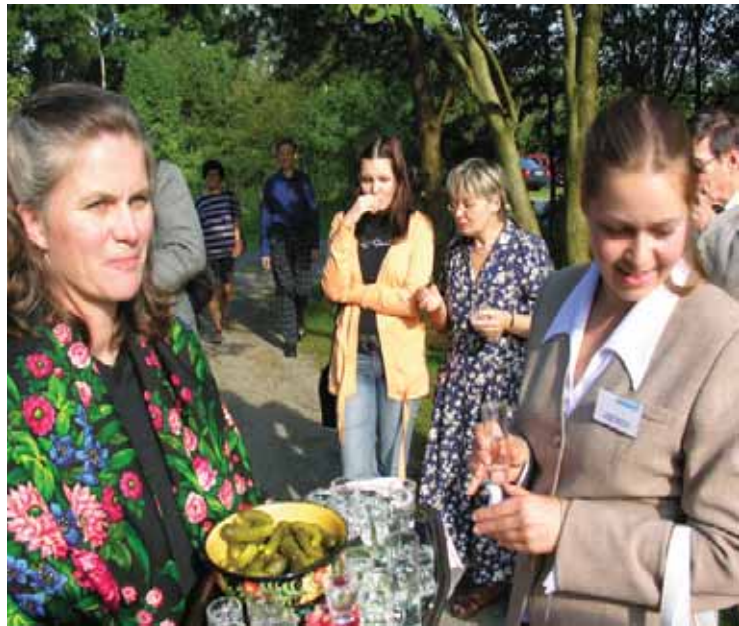
Russisches Dorf in Kirchhatten, 16. September 2006